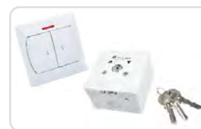
Przełączniki klawiszowe i kluczykowe