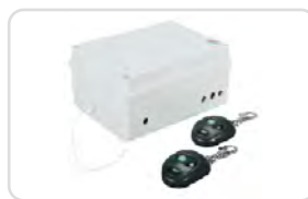
Centrałki z pilotami